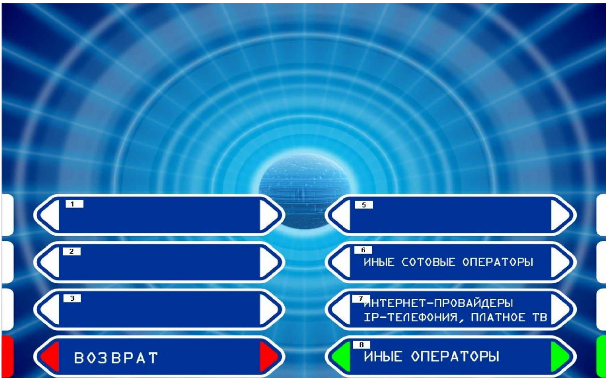
Рис. 1 Первое окно выбора операторов.